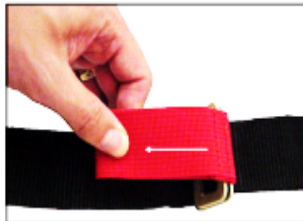
Figur 4. Løsne tilbakeholdenhet

For å løsne en fastholdelse, trekk utbruddstappen mot spennen (fig. 4). Fortsett å trekke til båndet er så løst som ønsket.