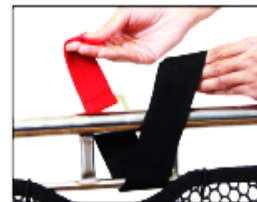
Figur 7. Passing Looped End Through Cove