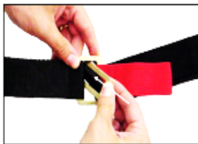
Figur 5. Løsne spennen

For å løsne fastholdelsesanordningen, løsner du først som i trinn nummer 1, vinkler deretter trebjelkespennen og fører den nedover gjennom åpningen i tobjelkespennen (fig. 5).